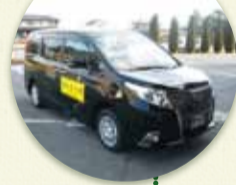
デマンドタクシー