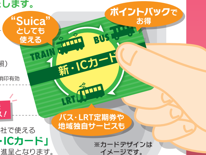
※カードデザインはイメージです。